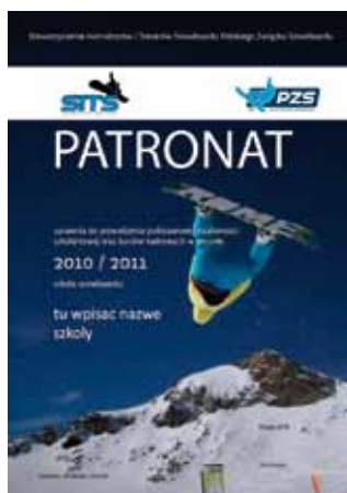
Wzór licencji oraz patronatu SITS-PZS.